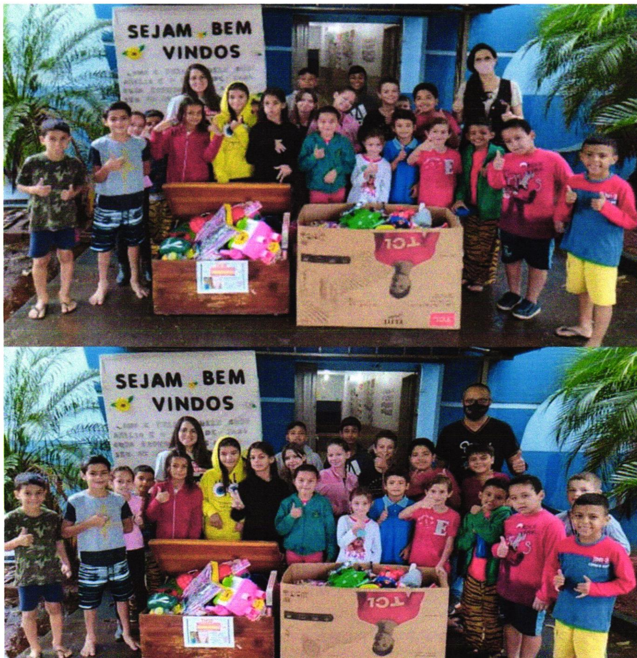
Crianças da Instituição Social Patrulha Mirim - MS 2021